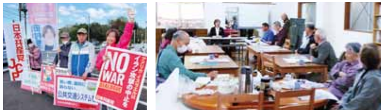
街頭での訴え・NOWARスタンディング なんでも語ろうカフェの開催