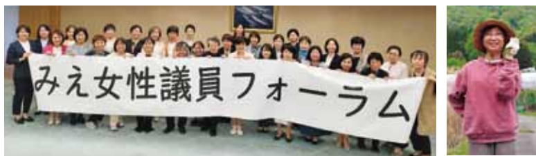
女性議員フォーラム参加 後援会のみなさんと蕨と